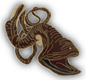
フウセンウナギ S-008 Saccopharynx

サイズ W35mm×H43mm (本体) 参考上代 400円 (税別) JAN : 4992791252996 入数 : 5個