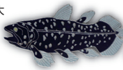
シーラカンス S-002 Coelacanthiformes

サイズ W51mm×H27mm (本体) 参考上代 400円 (税別) JAN : 4992791252897 入数 : 5個