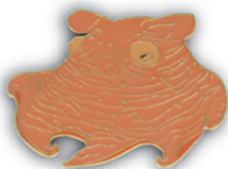
メンダコ S-010 Opisthoteuthis depressa

サイズ W44.5mm×H29.5mm (本体) 参考上代 400円 (税別) JAN : 4992791253009 入数 : 5個