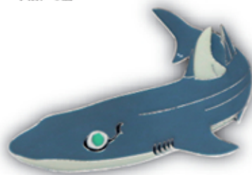
フトツノザメ S-009 Squalus mitsukurii

サイズ W52mm×H26.5mm (本体) 参考上代 400円 (税別) JAN : 4992791252927 入数 : 5個