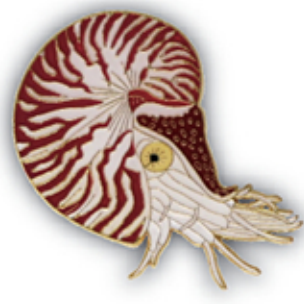
オウムガイ S-006 Nautilus pompilius

サイズ W49mm×H93mm (本体) 参考上代 600円 (税別) JAN : 4992791253023 入数 : 5個