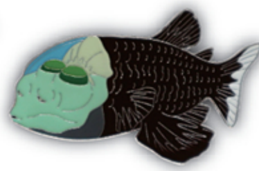
デメニギス S-014 Macropinna microstoma

サイズ W42mm×H24.5mm (本体) 参考上代 400円 (税別) JAN : 4992791253016 入数 : 5個