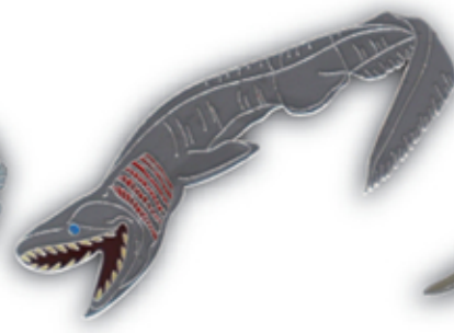
ラブカ S-003 Chlamydoselachus anguineus

サイズ W51mm×H27mm (本体) 参考上代 400円 (税別) JAN : 4992791252897 入数 : 5個