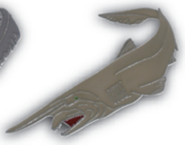
ミツクリザメ(ゴ布林シャーク) S-004 Mitsukurina owstoni

サイズ W55.5mm×H31mm (本体) 参考上代 400円 (税別) JAN : 4992791252910 入数 : 5個