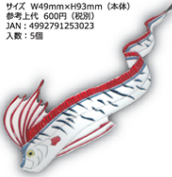
ダイオウイカ VS マッコウクジラ S-001 Architeuthis dux VS Physeter macrocephalus

サイズ W49mm×H93mm (本体) 参考上代 600円 (税別) JAN : 4992791253023 入数 : 5個