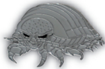
ダイオウゲソクムシ S-011 Bathynomus giganteus

サイズ W39.5mm×H29mm (本体) 参考上代 400円 (税別) JAN : 4992791252958 入数 : 5個