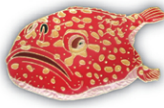
ミドリフサアンコウ S-013 Chaunax abei

サイズ W43mm×H30mm (本体) 参考上代 400円 (税別) JAN : 4992791252972 入数 : 5個